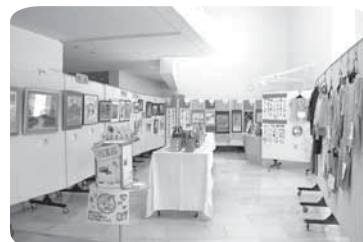
多くの作品が出展されました

〈出展方法〉出展希望者は、「高齢者名作展出展申込書」に必要事項を記入の上、お近くの福祉サポートセンターへお申し込みください。