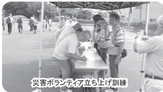
災害ボランティア立ち上げ訓練