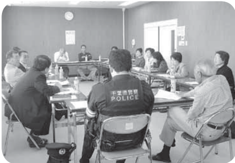
地域の情報交換の場として

これから地域の協力を得ながら、安心して暮らせる町づくりについて毎月話し合っていきます。