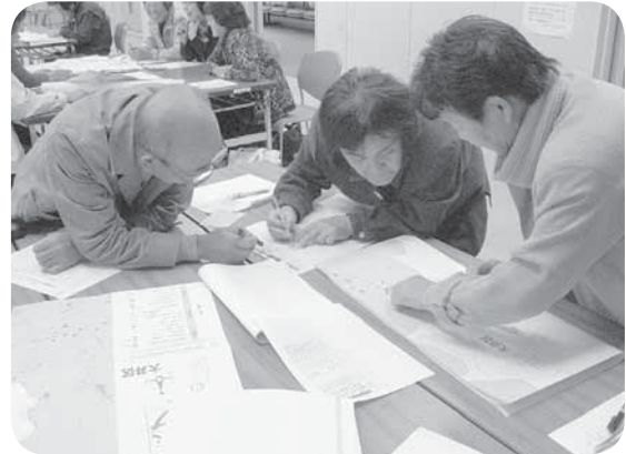
みんなで訪問先を確認中！

救急情報の更新はもちろんですが、直接顔を合わせる事でのコミュニケーションにもなり、おたがいに助け合える地域につながっています。