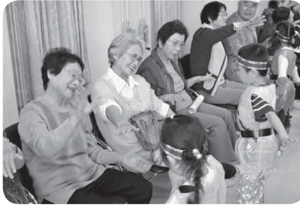
いーとーまきまき いーとーまきまき

今年度1回目の丸山いきいき交流会には、約130名の方が参加しました。午前中は、かわいい衣装をまとった園児達と手遊びをし、小さな手からたくさんの元