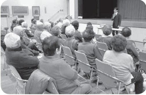
みなさん真剣です

最近の振り込め詐欺の手法やそれに対する対処などを説明していただき、改めて身近な犯罪なのだと考えさせられました。