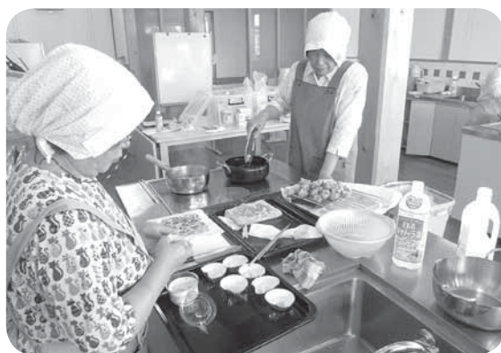
手間をかけて作っています

活動をしています。お弁当を食べられている方から「いつも美味しいお弁当ありがとう。楽しみにしているよ」と声を掛けられることもあり、活動の励みになっています。これからも地域の皆さんのお役に立てるよう、頑張っていきたいと思えます。