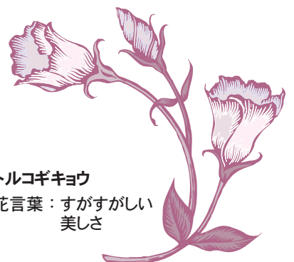
トルコギキョウ 花言葉：すがすがしい 美しさ

2年目を迎えたお達者サロン。地域の仲間が集まり、手作業やゲームを楽しんで、お茶を飲みながら、お仲間と世間話で楽しいひとときを過ごしています。