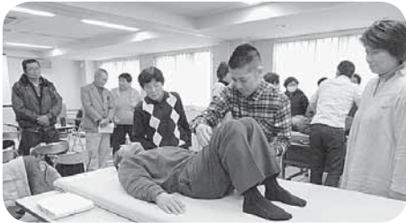
コツがわかりました

参加した方からは、「介護の仕方だけではなく、最後の看取りについても、これから自分たちが経験していくことになるだろうから、すごく共感できることもあった。」との感想も聞かれ、とても有意義な講座となりました。